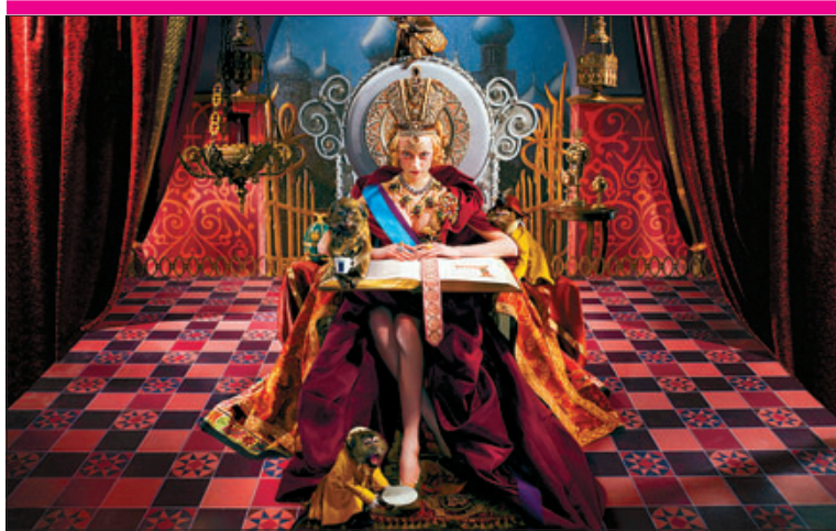
►► Recreación de la reina Vanalika II, vestida por Vivienne Westwood.