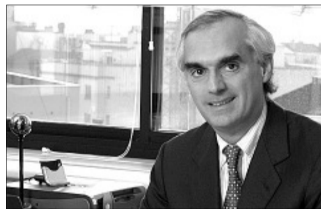
El presidente de NH, Gabriele Burgio, anunció ayer que la cadena ha sobrepasado las 50.000 habitaciones.

El presidente de NH considera que se trata de “un golpe magistral de publicidad”